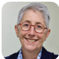
Mona BLANCHET (Le Dauphiné libéré)