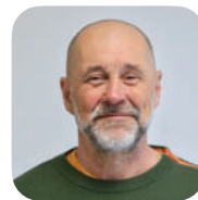
Yves KLEIN (L'Union)