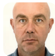
Anthony ORLIANGE (CAPA PRESSE)