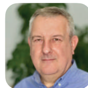
Christophe NIEULAC (TF1)